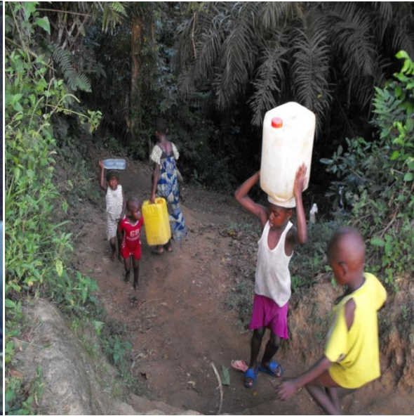
Wasserquelle Nr. 1 vor Bau mit Kinder. Kinder holen Wasser von die Quelle