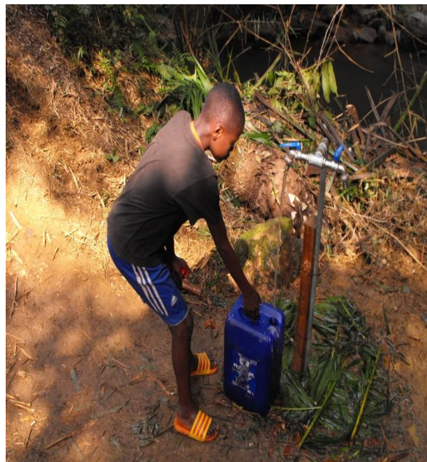
Das Wasser fließt seit Dezember 2012