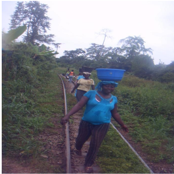
Frauen bei der Arbeit. Sand und Kies wurden von die Frauen transportiert.