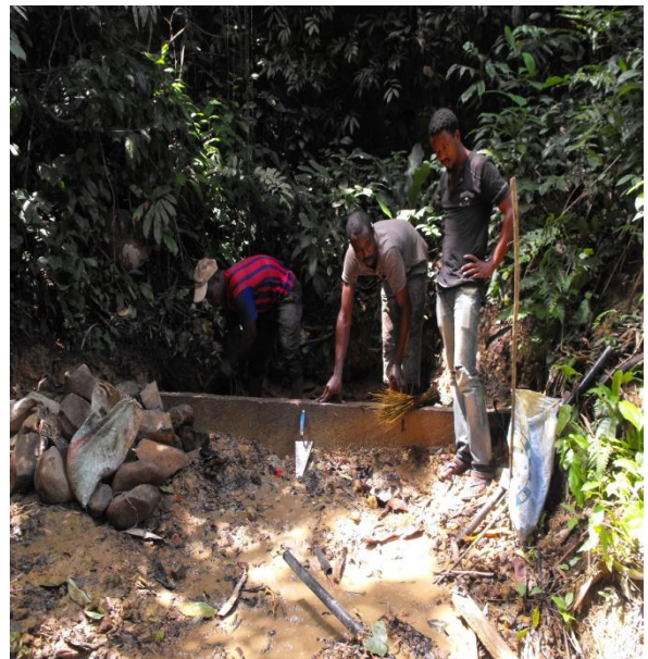
Wasserquelle Nr. 2 Betonierung