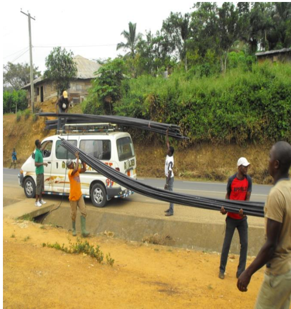
Ankünfte von PVC-Röhren aus Kumba