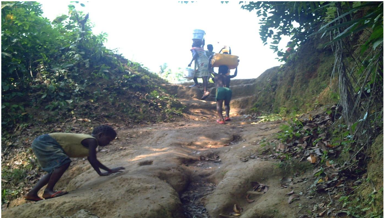
Kinder von Wasserquelle mit 20L Kanistern Bergauf Richtung Dorf.