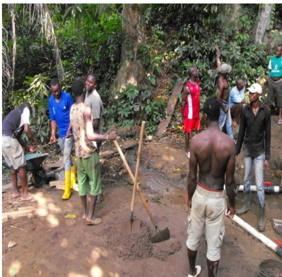
Gemeindearbeit mit Leute von Ferdinard & Sons Ltd