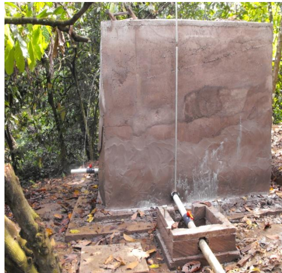
Beton Wassertank Nr. 1 mit Ventil und Ausgangsröhr richtung Dorf.