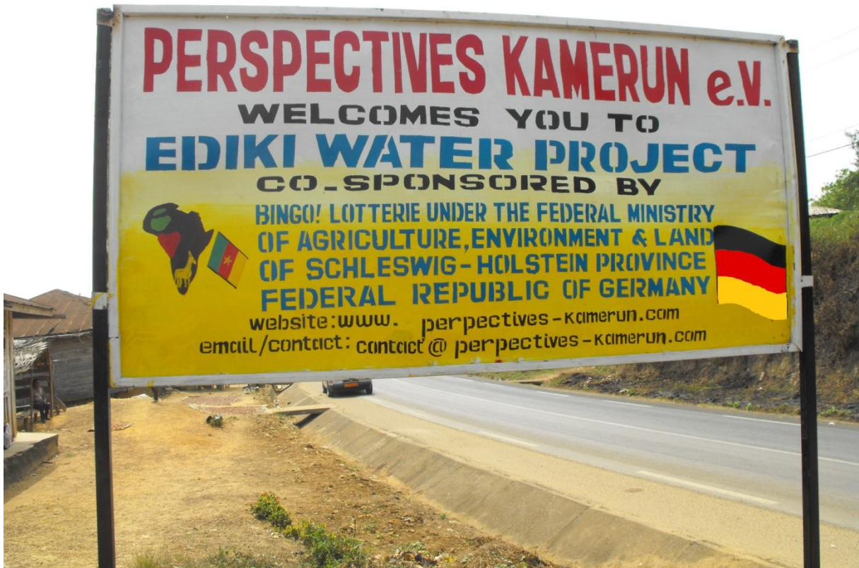
Plakat in Ediki Dorf.