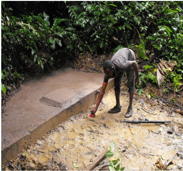
Wasserquelle Nr. 2 Betoniert.