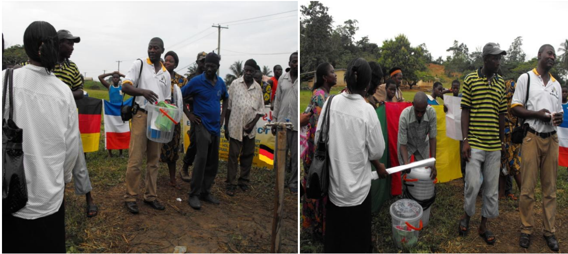
Übergabe von Wassereimern & Trinkberchern an die Schule in Ediki