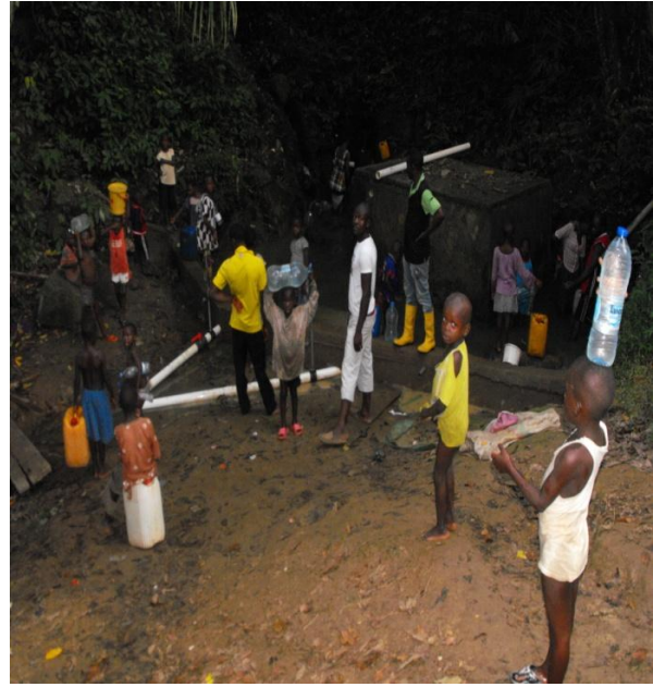
Wasserquelle Nr. 1 bei der Betonierung