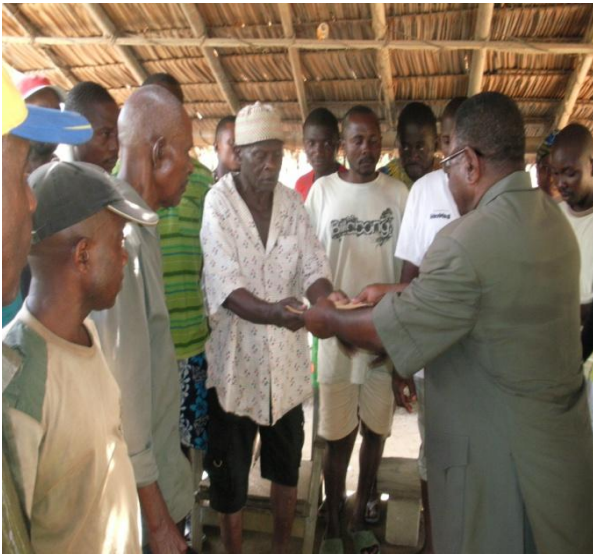
Geldübergabe am 27 Oktober 2012 in Ediki Dorf