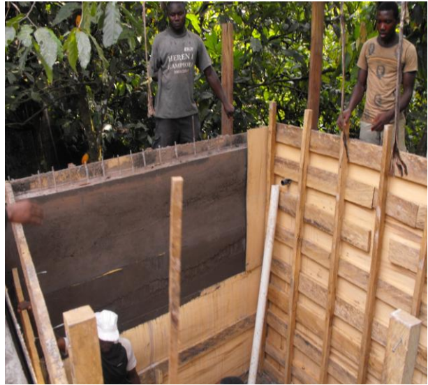
Holz Entfernung nach der Tankbetonierung.