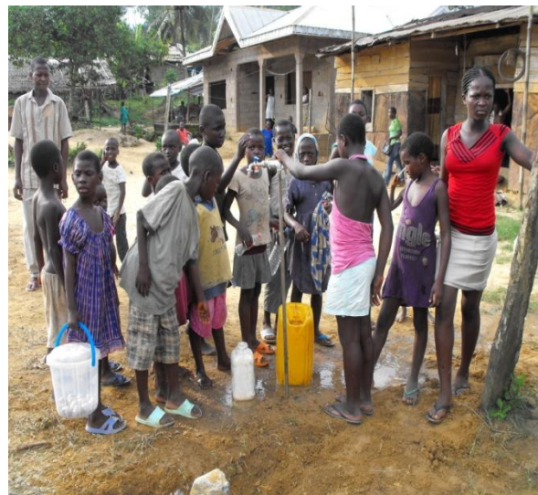
Wasserhahn in Dorfszentrum mit Kinder