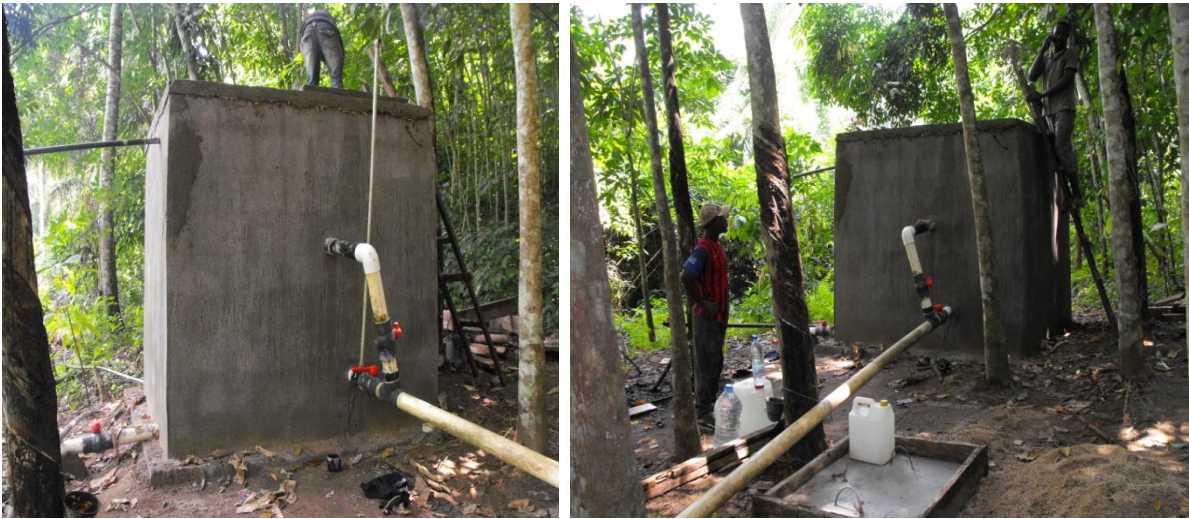
Wassertank Nr.2 Betoniert mit zwei Ausgangsröhren Richtung Dorf.