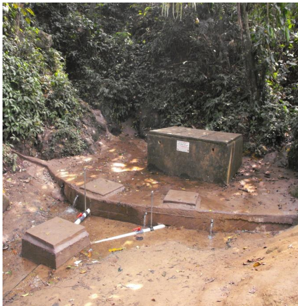
Wasserbecken Nr.1 betoniert mit Ausgangsröhren.