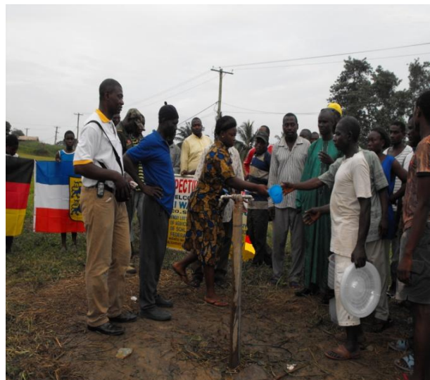
Projektabschluss und Übergabe am 29 Mai 2013 in Ediki