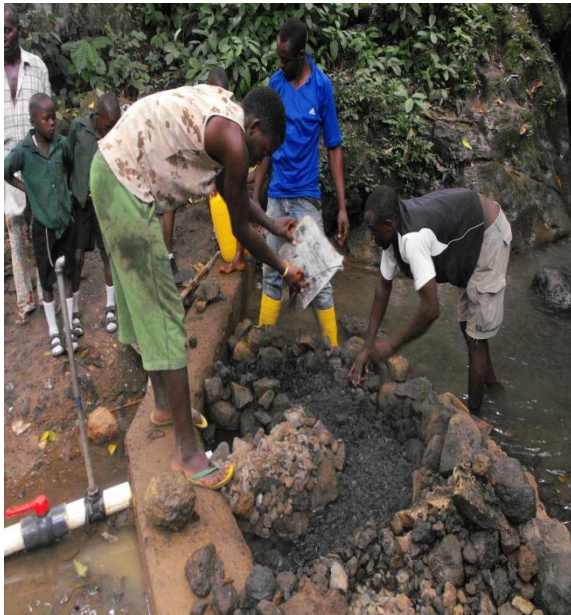
Bau von Filtrierungsschichten