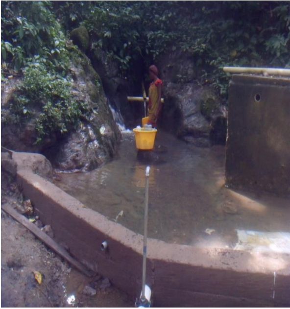
Wasserquelle Nr.1 vor Beckenbau