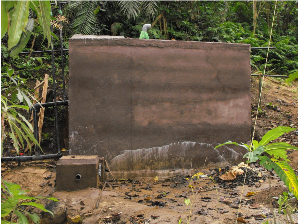
Der Wassertank im Wald mit Eingang-, Überfluss- und Ausgangsröhren