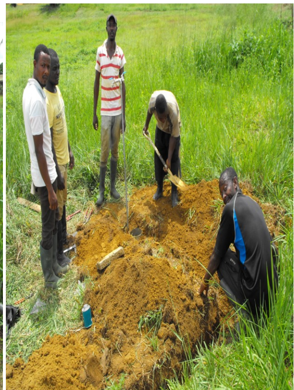
Instalation von Wasserhahn im Dorf