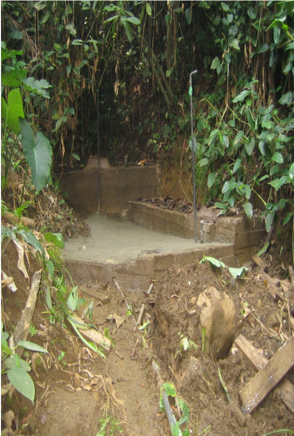
Lobe road Wasserquelle Betoniert