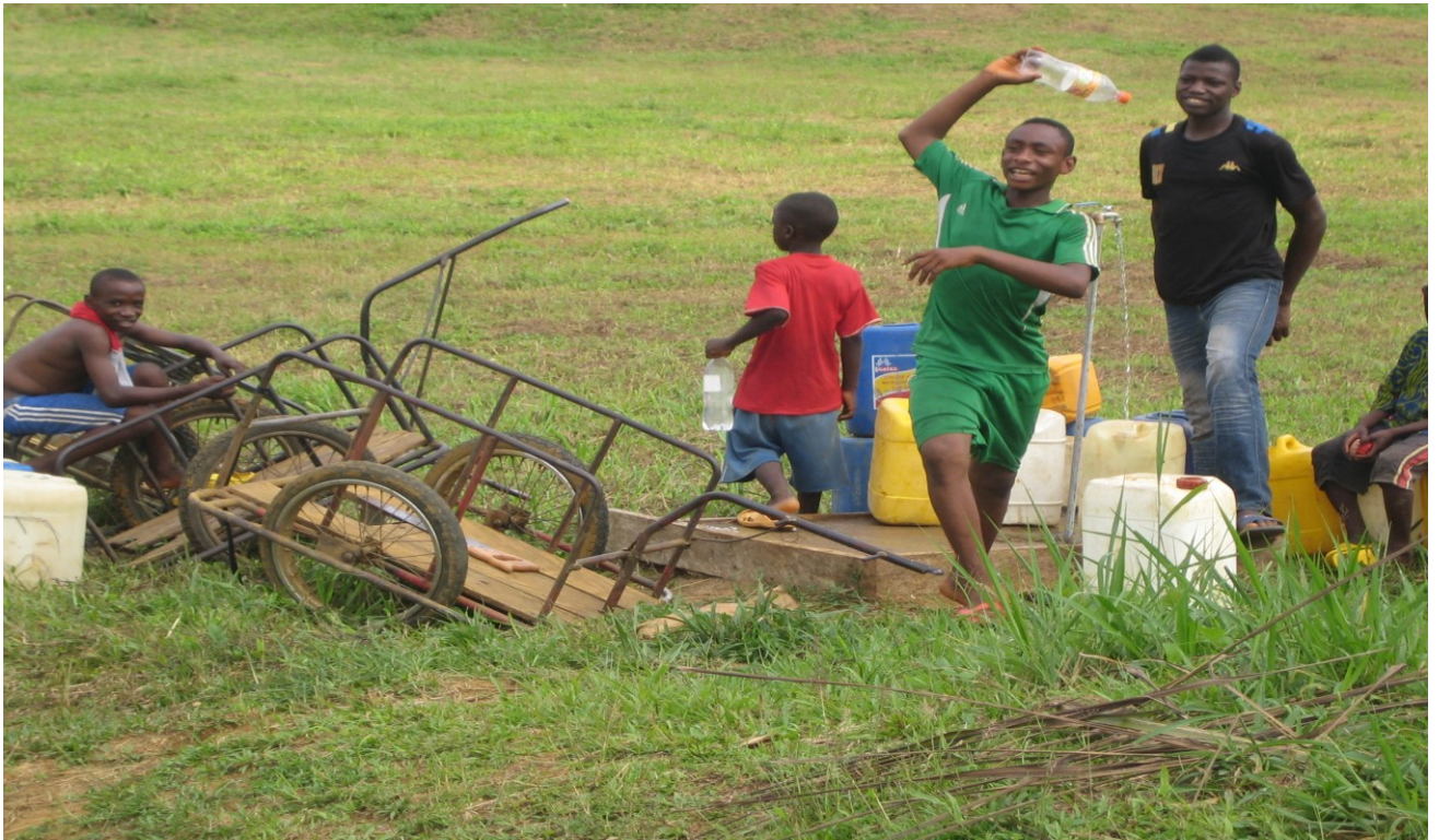
Die Kinder sind sehr Zufrieden mit der Entwicklung in Mbonge Maromba.