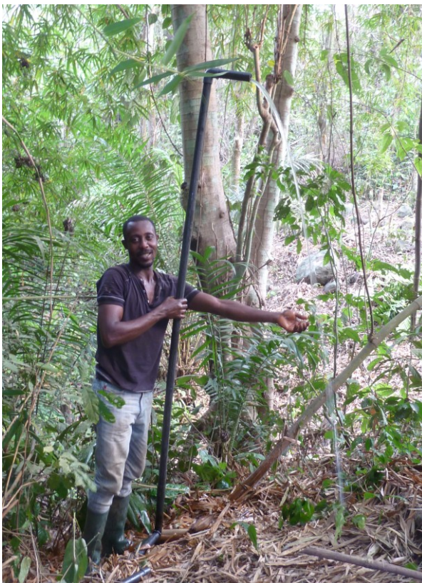
Wasser fließt bis 4 meter Höch