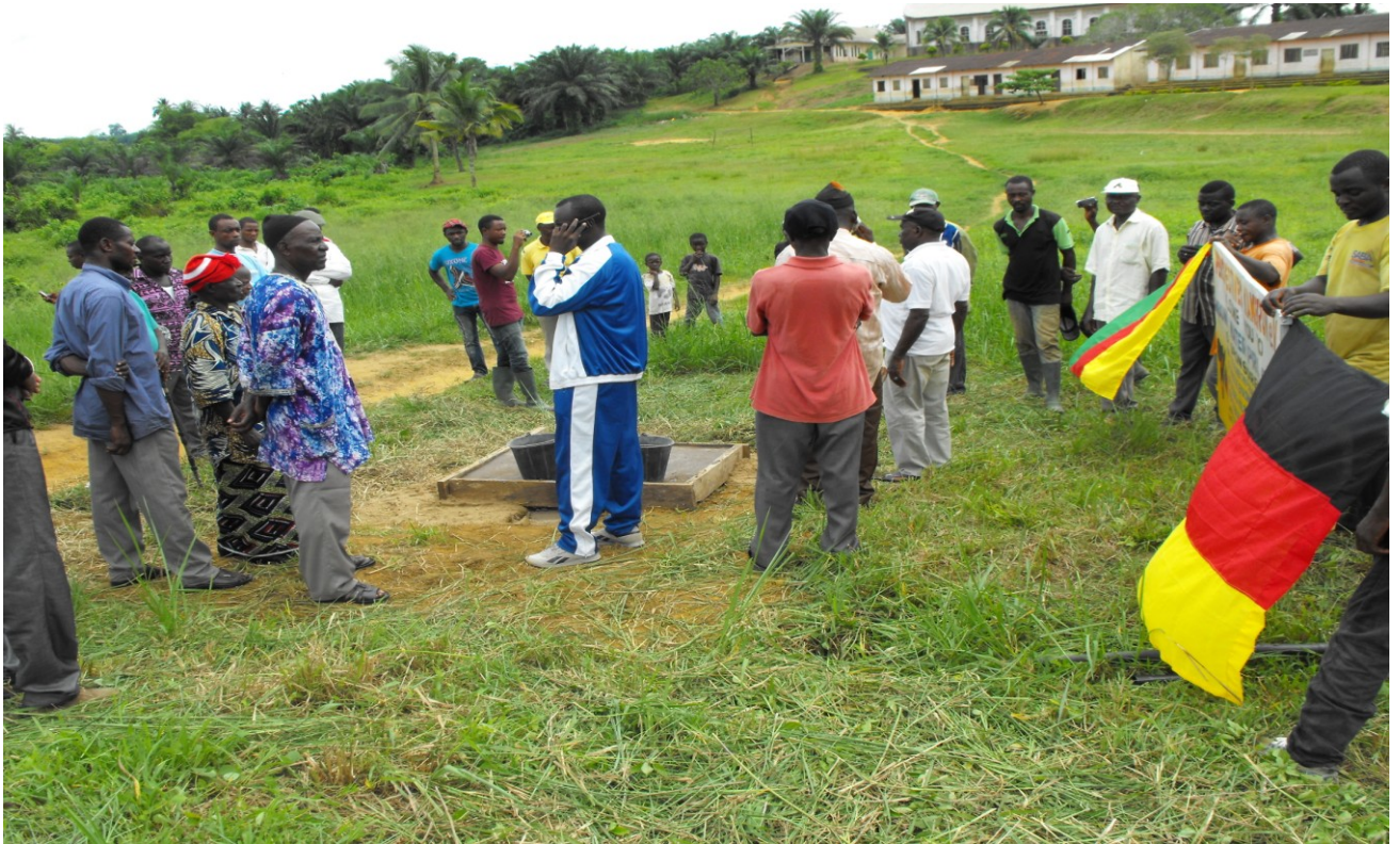
Wasserhahn bei der Katholische Mission Schule Mbonge Maromba