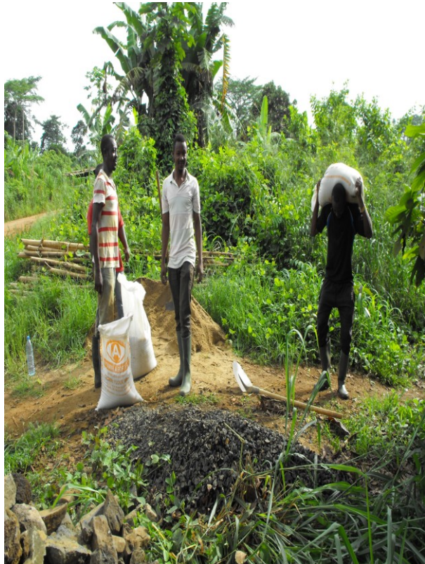
Baumaterial transportiert auf dem Kopf bis zirka 1km von Strassenrand