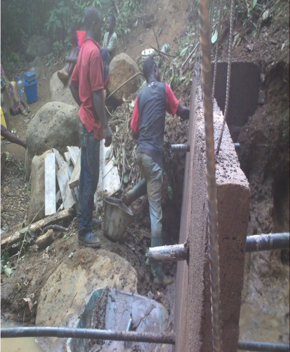
Betonierung Wasserquelle „Stone Water“.