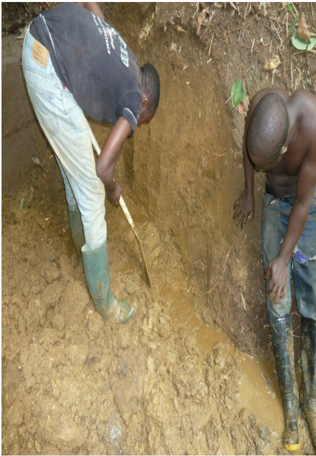
Suchen nach Wasser