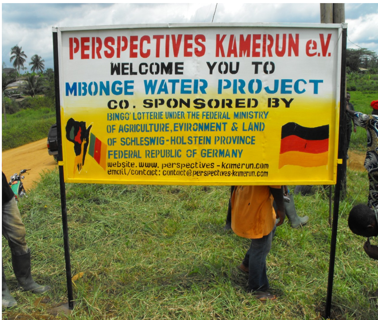
Plakat in Mbonge Maromba Dorfgemeinde.