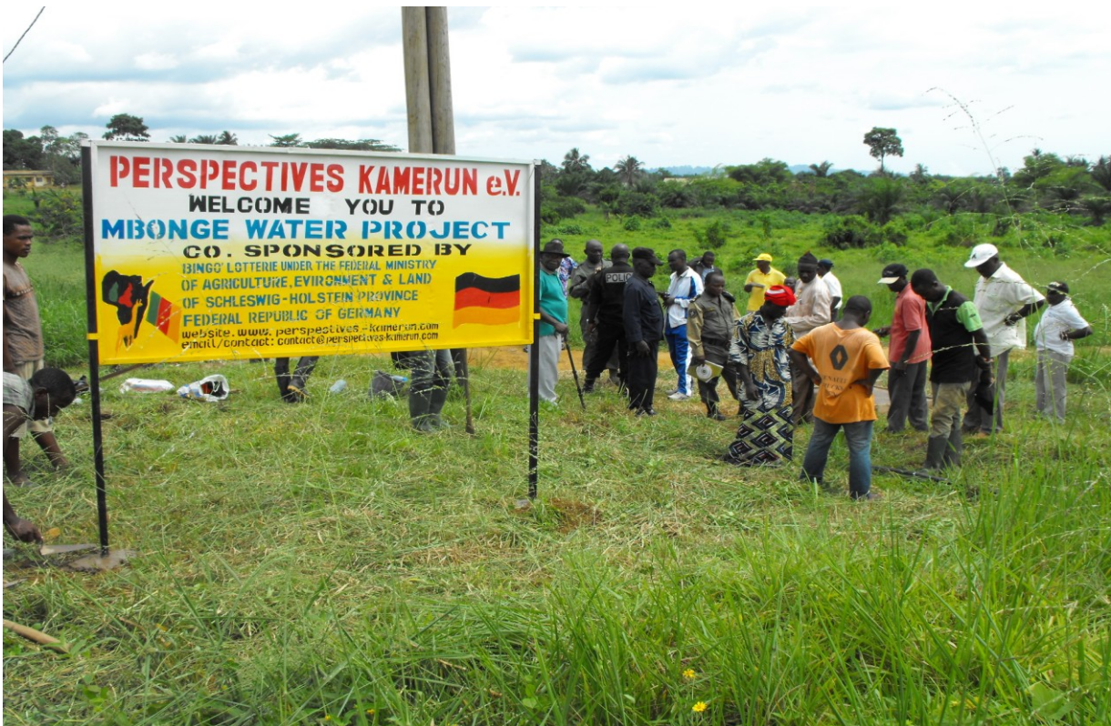
Projektabschluss und Wasserleitung Übergabe am 10 Mai 2014 in Mbonge Maromba.

Mehr Bilder und Info in Website www.perspectives-kamerun.com