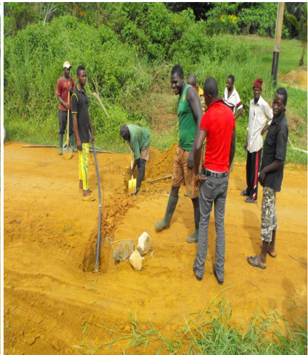
Gemeindearbeit Röhren Begrabung unter eine Hauptstrasse