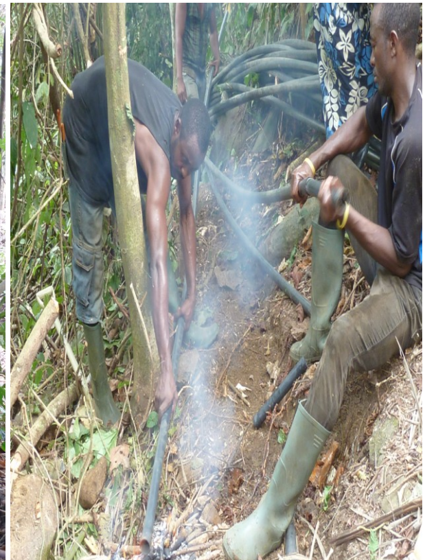
Wasserröhren Verbinden im Wald.