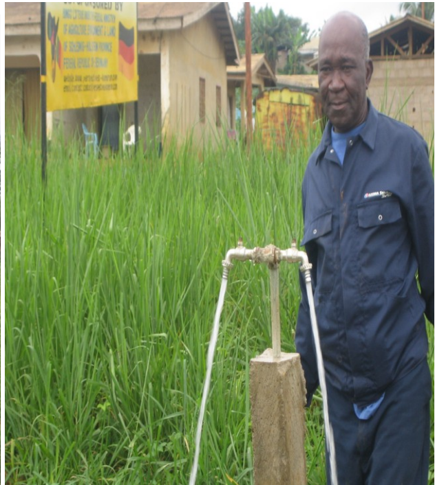
Wasserhähne in Mbonge