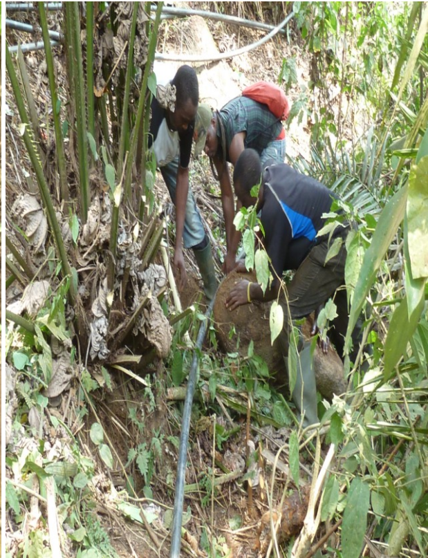
Wasserleitung Verlegung im Wald