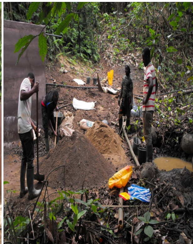
Betonmischung per Hand im Wald.