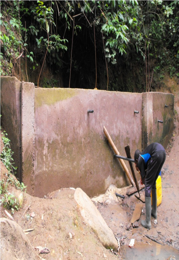
Stone Water Wasserquelle Betoniert