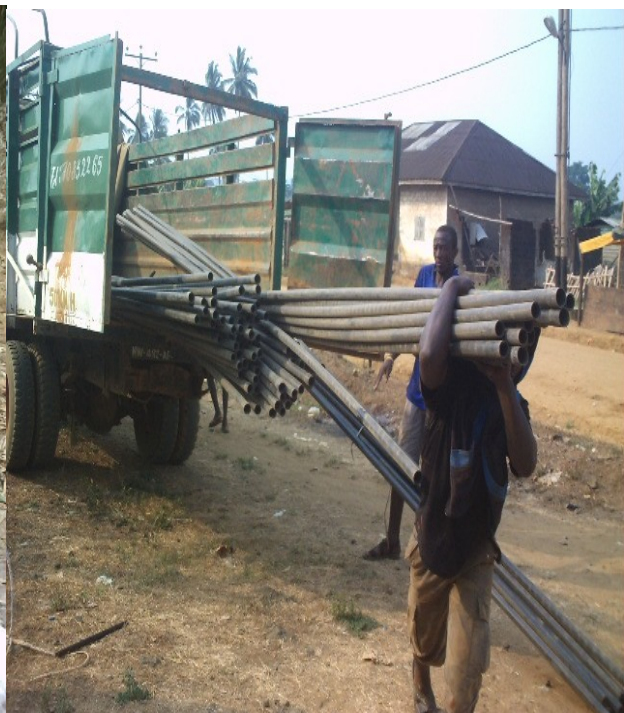
Röhren Ankunft in Mbonge Maromba