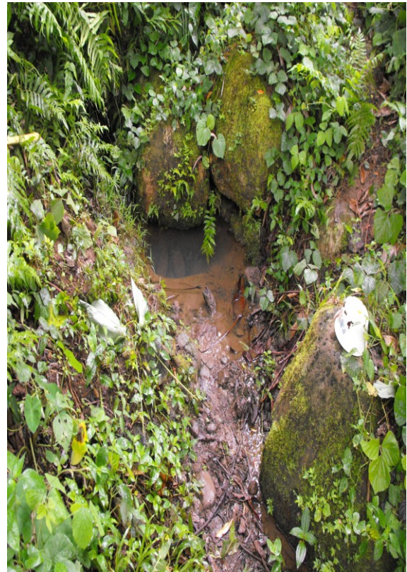
Stone Water (L) & Lobe Road (R) Wasserquellen in Mbonge vor die Bau.