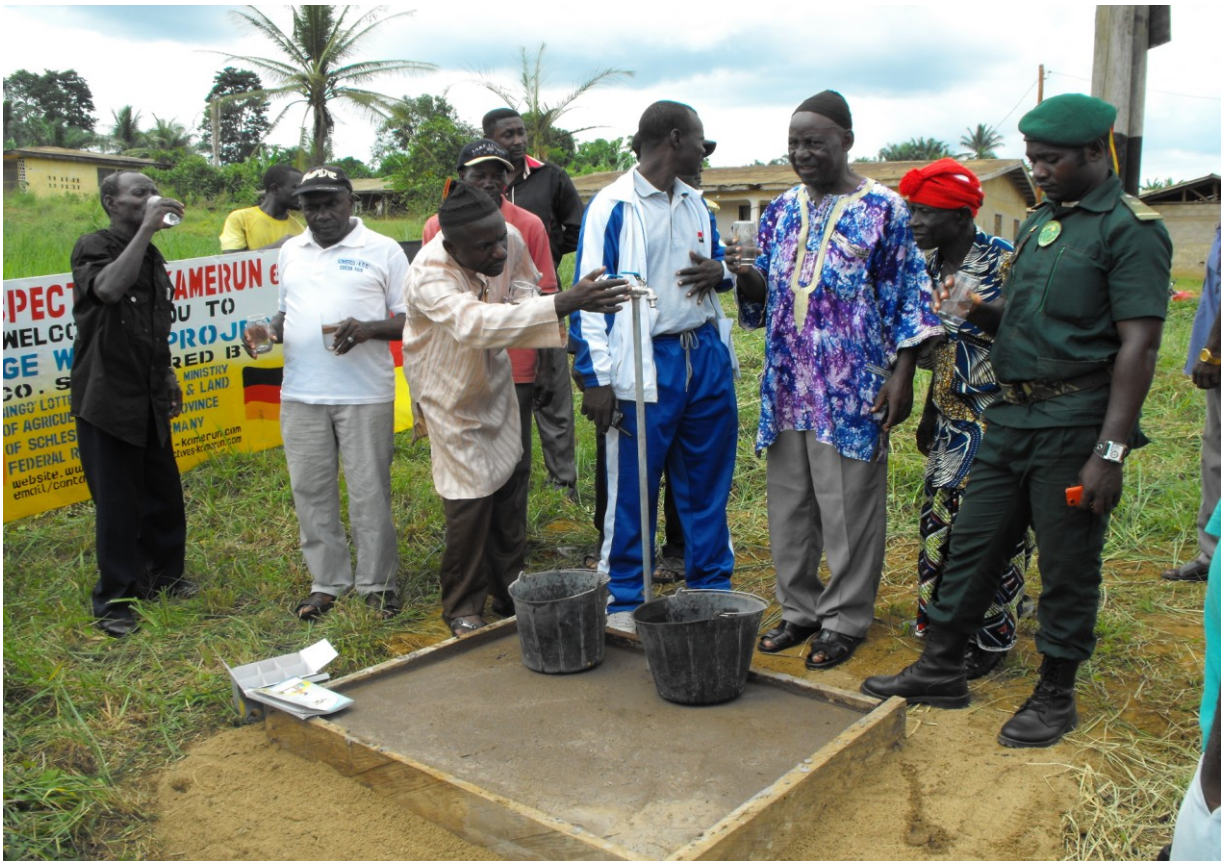
Wasserleitung Übergabe an die Dorfgemeinde von Mbonge Maromba 10 Mai 2014