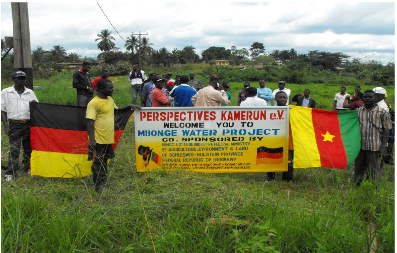
Übergabe Zeremonie in Mbonge Maromba am 10 Mai 2014.