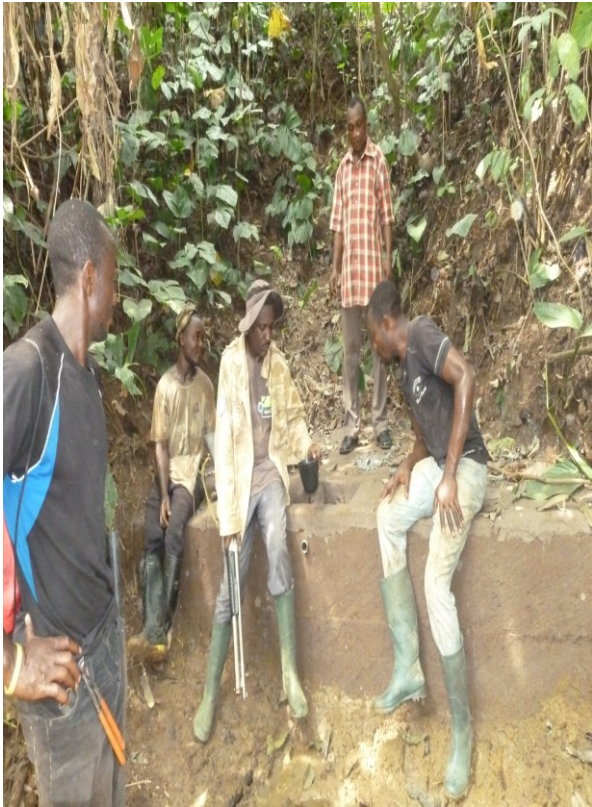
Besichtigung bei das Wasserkomitee