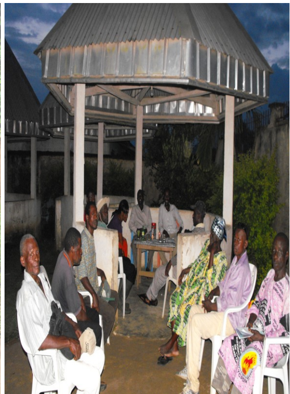
Besichtigung Delegation und Besprechung im Palace 28 Mai 2012