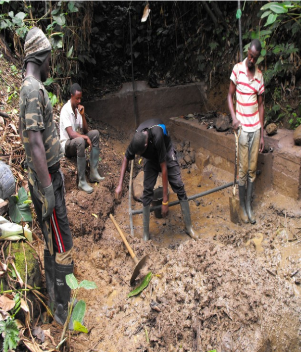
Bau Wasserquelle Lobe road.