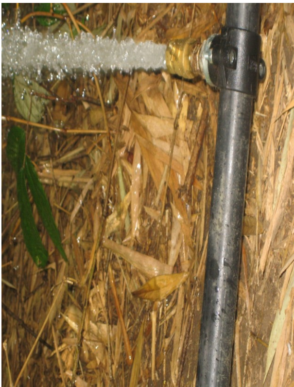
Luftabweichungventil in Zwischenabständen Instalirt.